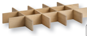
«VALO» Einsatz für Holzbox GN 1/1 Insert pour base bois GN 1/1 Eichenholz geölt, Einsatz mit Fächern 9,5 x 9,5 cm Bois de chêne huilé, insert avec compartiments 9,5 x 9,5 cm