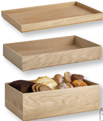
«VALO» Holzbox GN 1/1 Base bois GN 1/1 Eichenholz geölt Bois de chêne huilé