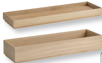
«VALO» Holzbox GN 2/4 Base bois GN 2/4 Eichenholz geölt Bois de chêne huilé