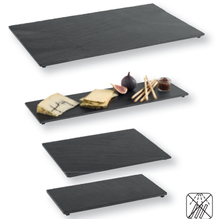
«VALO» Naturschieferplatte GN Plat ardoise GN

Naturschiefer, hervorragende Kältespeicherung, wasserdichte Oberfläche, nicht spülmaschineneignet, mit rutschfesten Füßchen Ardoise naturelle, emmagasinage de froid remarquable, surface imperméable à l'eau, ne convient pas au lave-vaisselle, pieds anti-glisse.