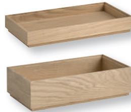
«VALO» Holzbox GN 1/3 Base bois GN 1/3 Eichenholz geölt Bois de chêne huilé