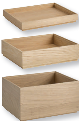
«VALO» Holzbox GN 1/2 Base bois GN 1/2 Eichenholz geölt Bois de chêne huilé