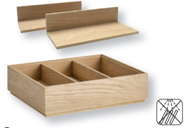
«VALO» Einsatz für Holzbox GN 1/2, 2er Set Insert pour base bois GN 1/2, set de 2 Eichenholz geölt, Einsatz mit 3 Fächern Bois de chêne huilé, insert avec 3 compartiments