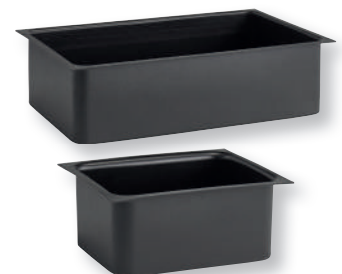
«VALO» Einsatz GN Bac supérieur GN Polystyrol Polystyrène